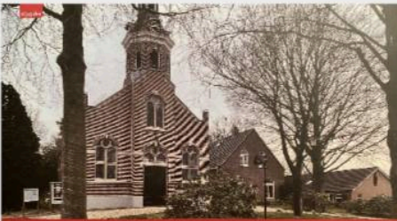
Toekomst kerkelijk erf Okkenbroek